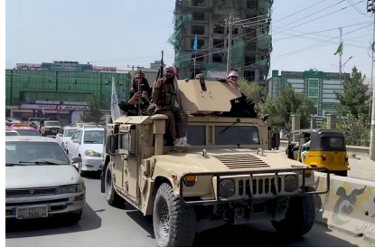
Convoi taliban en 2021

L'OTAN est parti en guerre en Afghanistan pour déstabiliser la Chine. Les ONG créées là-bas s'accaparent l'argent prévu pour le peuple Afghan. Pourtant les talibans, une ethnie unie avec le peuple Afghan par la même religion, auront toujours lutté contre la drogue, l'OTAN installe la culture du pavot dans le pays.